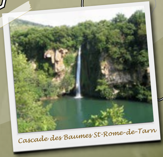
Cascade des Baumes St-Rome-de-Tarn