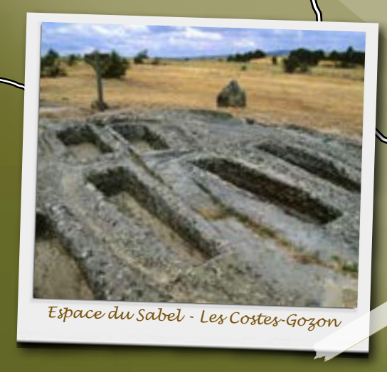
Espace du Sabel - Les Costes-Gozon