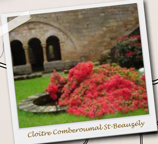
Clotire Comberoumal, St-Beauzély