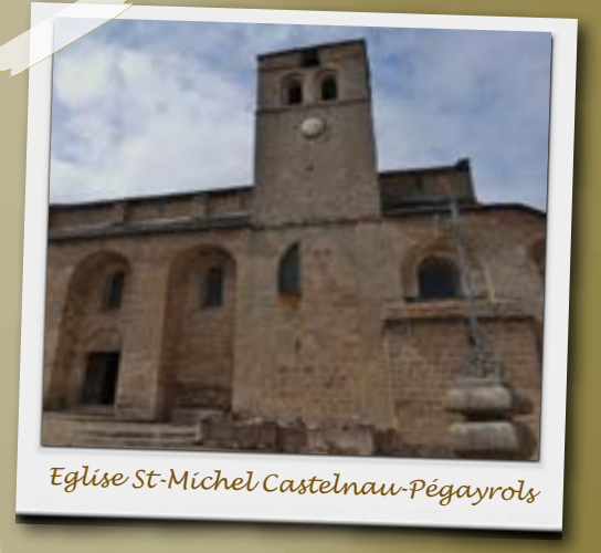
Eglise St-Michel Castelnau-Pégayrols