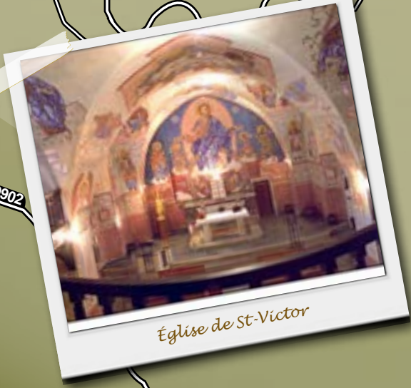
Eglise de St-Victor