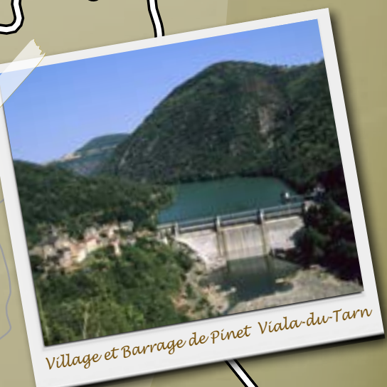
Village et barrage de Pinet, Viala-du-Tarn